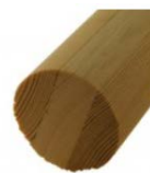
RUNDSTAV FURU 43X43X900MM