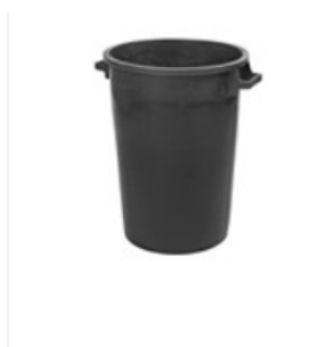
Vattentunna 75 l ★★★★☆ (6)