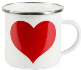
Emaljmugg med hjärta 68,00 kr från kalasdekorationer.se

Emaljmuggar som flyttas på mellan stolparna. Lite trixigt att hitta men finns på diverse hemsidor tex: